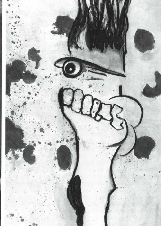
„Kopflandschaft“ und „Urknall“ (1998): Ironie und Sarkasmus

Die Bilder entstehen in drei Schritten. Am Beginn stehen Hunderte spontaner Zeichnungen. Sie werden im Übermaß produziert und irgendwann zu komplexeren Kompositionen, zu „Ideenfindungen“ – gegen den Begriff „Studien“ wehrt er sich – kombiniert. Beide verlassen niemals das Atelier. In einer weiteren Phase können daraus Serien entstehen, die aber im Gegensatz zu den beiden ersten Vorstufen bereits den Ansprüchen eigenständiger Kunstwerke genügen. Diese meist als Zeichnung ausgeführten Arbeiten bilden einen Großteil seines Schaffens. Den anderen Teil stellen die